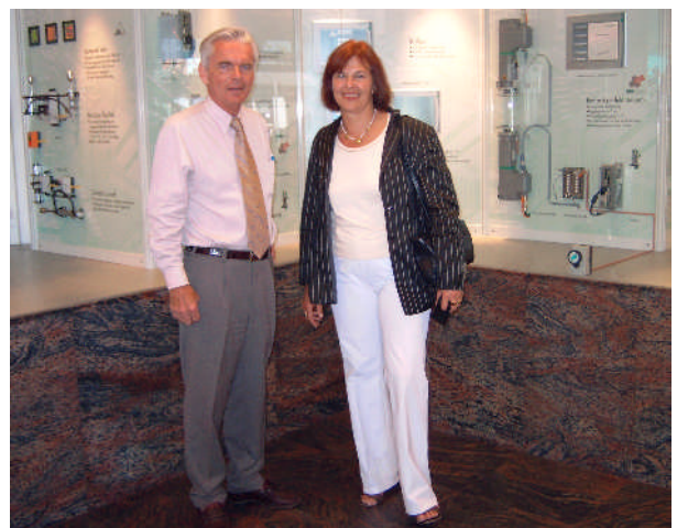
...und bei Firma Kuhnke in Bad Malente