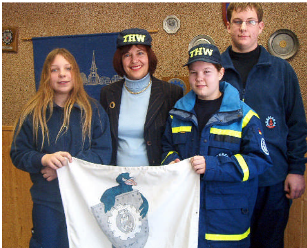
Im Januar 2006 mit jugendlichen Mitgliedern des THW