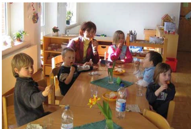
Im März 2006 Besuch im Kindergarten Merkendorf