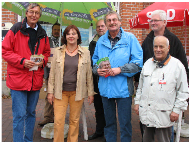
Auf dem Markt in Heiligenhafen...

Unterstützung der Ortsvereine im Landratswahlkampf im Herbst 2006