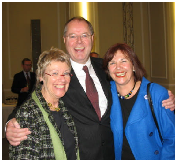
Im Januar 2007 anlässlich des 60. Geburtstages von Finanzminister Peer Steinbrück (links Kollegin Petra Merkel, MdB)