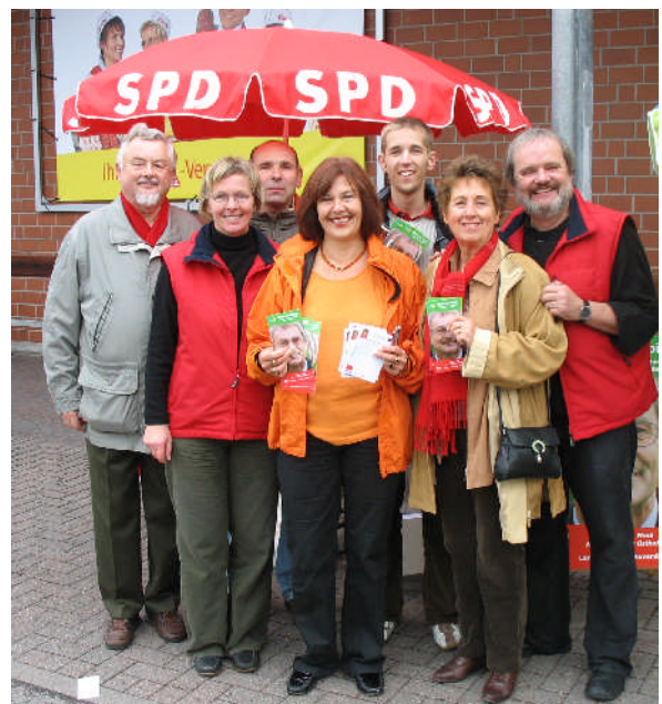
...und in Stockelsdorf