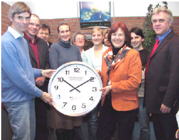
Im Februar 2006 die „Ganztagsschuluhr“ des Bundesbildungsministeriums für die Gorch-Fock-Schule in Heiligenhafen