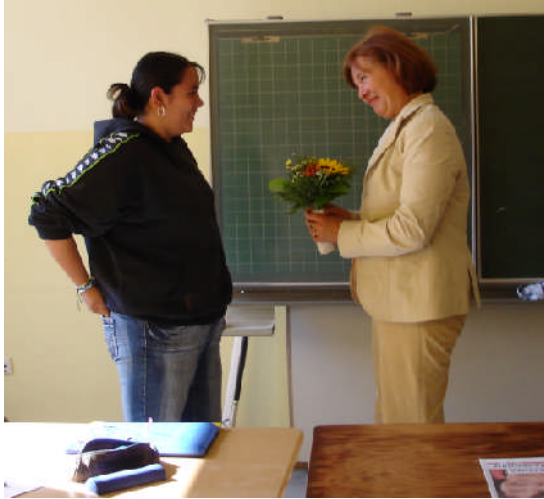
Im September 2006 zu Gast in der Klasse 9a der Grund- und Hauptschule Burg auf Fehmarn