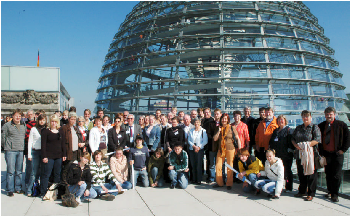
Im April 2007: 50 BürgerInnen aus meinem Wahlkreis in Berlin