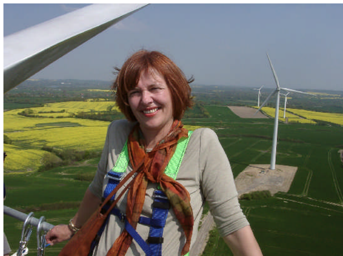
Bei der Besichtigung des Windpark Kesdorf: ganz oben!