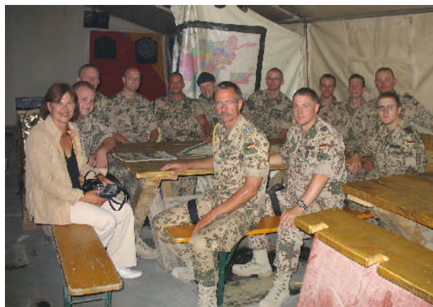
und dem Treffen mit den Eutiner Soldaten der Panzeraufklärungskompanie 70 in Kabul im Mai 2006