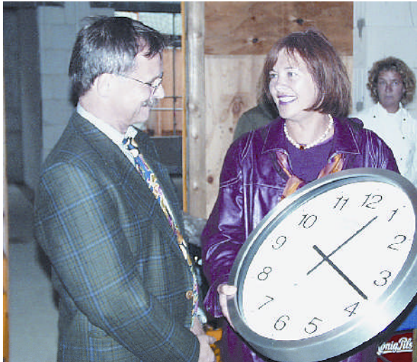
Uhrenübergabe in der Albert-Mahlstedt Schule Eutin im Oktober 2005

Matthias-Claudius-Schule in Reinfeld, der GHS Ratekau, Lensahn und Timmendorfer Strand sowie in der Steinkamp-Schule Neustadt. Im Oktober 2005 besuchte ich die Albert-Mahlstedt-Schule Eutin und die Kastanienhofschule in Oldenburg. Im Dezember 2005 war ich in der Waldorfschule Lensahn und im Februar 2006 in der Gorch-Fock-Schule Heiligenhafen. Im März 2006 besuchte ich die GHS Göhl und im Februar 2007 die Ganztagschule an den Auewiesen in Bad Malente.