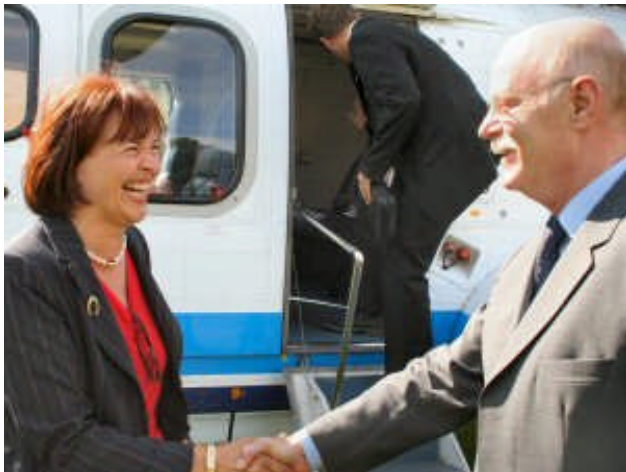
Mit Peter Struck beim Besuch von Bundeswehrstandorten