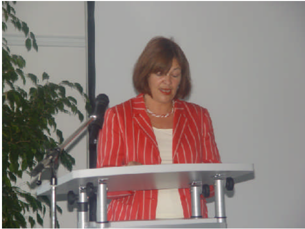
Im Oktober 2006 zum 30 jährigen Bestehen des Bildungswerkes Bugenhagen als Gastrednerin