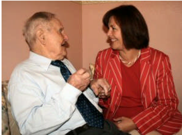
Besuch im CURA Seniorenzentrum Ahrensböck im August 2005