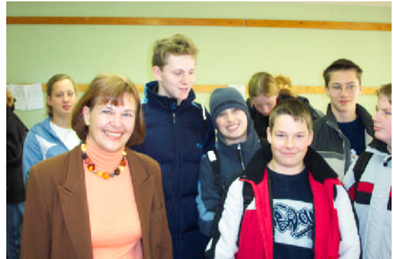
Besuch im WIPO Unterricht im Dezember 2005 in der Realschule Burg