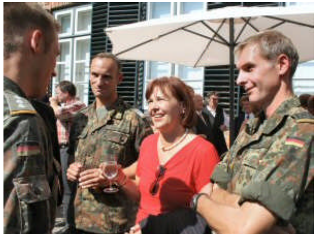
...und beim abschließenden Empfang im Eutiner Schloß

Im Haushaltsausschuss konnte ich dazu beitragen, Arbeitsplätze in der Region zu sichern: die Lübecker Firma Dräger erhielt im Juli 2005 durch meine Initiative und nach zwölf Monaten zähem Ringen den Zuschlag für einen 48 Millionen Euro Auftrag der Bundeswehr, wodurch die Soldaten mit modernen ABC-Schutzmasken ausgestattet werden. Der Auftrag sichert bei Dräger Arbeitsplätze von 2005 bis 2009 in erheblichen Umfang. Ich hatte Dräger vorher zweimal mit der zuständigen SPD-Haushälterin für den Verteidigungsbereich besucht und sie detailliert über den Wert des Auftrags für die Soldaten informiert.