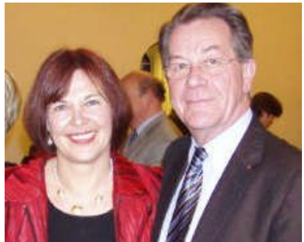
Mit Franz Müntefering im Januar 2006 beim Neujahrsempfang der SPD Ostholstein in Neustadt