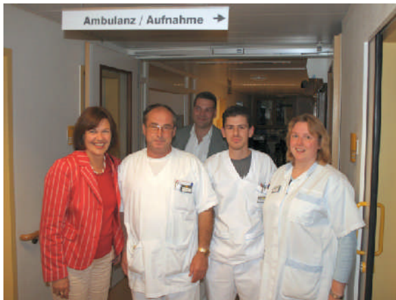
Besuch im Schön Klinikum in Neustadt im August 2005