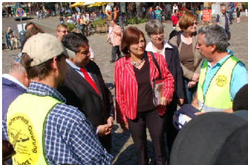
Oldenburger Marktplatz: im Gespräch mit Mitstreitern des Aktionsbündnisses gegen eine Feste Beltquerung und Sigmar Gabriel

die notwendigen politischen Antworten darauf wieder eine größere Aufgeschlossenheit. Deshalb habe ich mit kostenlosen Filmvorführungen des Al-Gore-Films „Eine unbequeme Wahrheit“ , die ich zusammen mit den jeweiligen SPD-Ortsvereinen ab September 2007 in Eutin, Scharbeutz,