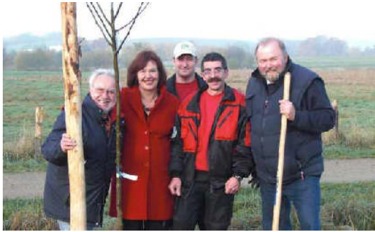
November 2008: Pflanzung eines roten Boskop auf der neuangelegten Streuobstwiese in Malente.