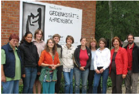
Zu Besuch bei der Gedenkstätte Ahrensböök am 18.08.08 mit jungen Freiwilligen.

Konzentrationslager untergebracht war, sondern das gleichzeitig ein Ort des KZ-Todesmarsches durch den Kreis Ostholstein 1945 zur Verschiffung in Neustadt war (Cap-Arcona-Katastrophe/3. Mai 1945), ist seit den 90er Jahren Dank des ehrenamtlichen Engagements der „ Gruppe 33 “ ein Ort