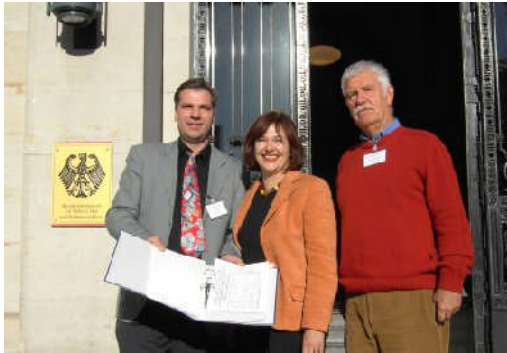
Vor dem Verkehrsministerium in Berlin - Unterschriftenübergabe im Oktober 2007.

Unterschriften gegen die Lärmbelästigung bei Anwohnern und Urlaubern. Im Sommer 2006 holte ich die zuständige Staatssekretärin im Verkehrsministerium, MdB Karin Roth , zu einem Gespräch mit Bürgermeistern, Vertretern der Tourismusbranche und der Bürgerinitiative nach Ostholstein, um