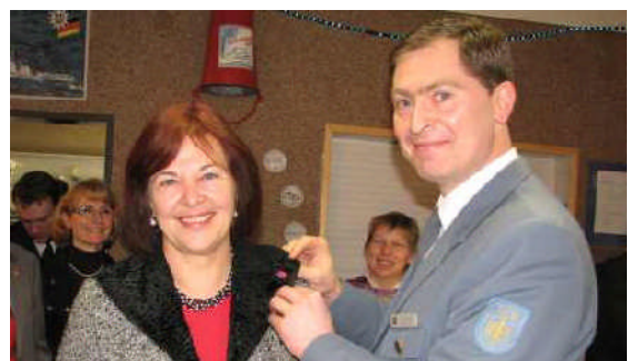
25. Januar 2009: Neujahrsempfang des THW in Neustadt mit dem Landesbeauftragten Dirk Hansen.