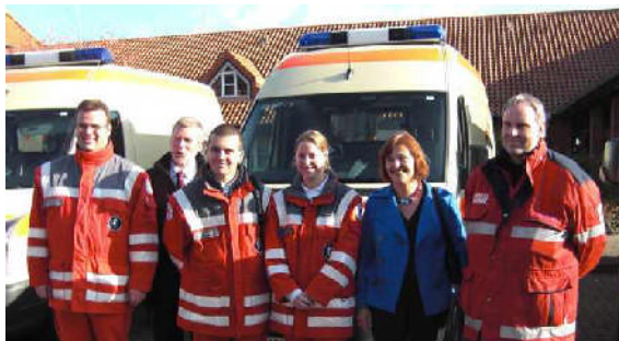
Oktober 2008: 16 neue Katastrophenschutzfahrzeuge für Schleswig-Holstein – es freuen sich das DRK in Bad Schwartau und Heiligenhafen.