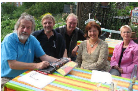
Eutin soll 2009 „Hauptstadt des Blues“ werden.

Meine Schlüsselstellung im Haushaltsausschuss konnte ich zugunsten Schleswig-Holsteins und meines Wahlkreises bei wichtigen Haushaltsverbesserungen z.B. für die Bereitschaftspolizei in Eutin, die Ortsgruppen und Jugendarbeit des THW und die dänischen und friesischen Minderheiten nutzen, vor allem aber für den Erhalt wichtiger Bundespolizeistandorte (z.B. in Neustadt, Lübeck und Ratzeburg) bei der Bundespolizeireform im April 2007. Das Maritime Schulungszentrum der Bundespolizei in