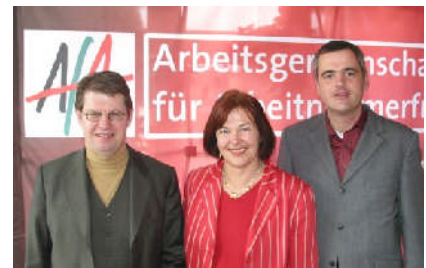
SPD - Landesvorstand

Wichtige Schwerpunkte von mir waren in der Arbeitsgruppe für Kommunalpolitik auch der Kampf um gesetzliche Festlegungen für Erdkabel (2006 im Infrastrukturbeschleunigungsgesetz und jetzt 2008 im Energieleitungsausbaugesetz EnLAG) sowie die Sicherung der Situation von Stadtwerken im Wettbewerb mit den "Energimultis". Mit diesem Engagement knüpfte ich gern an meine 20jährige kommunalpolitische Arbeit am Bungsberg an – die letzten sechs Jahre bis 2003 als ehrenamtliche Bürgermeisterin und Amtsvorsteherin. Seit 2003 arbeite ich im SPD-Landesvorstand – seit 2007 als stellvertretende Landesvorsitzende. Und auch dort gilt mein besonderes Augenmerk neben anderen Themen insbesondere dem ländlichen Raum.