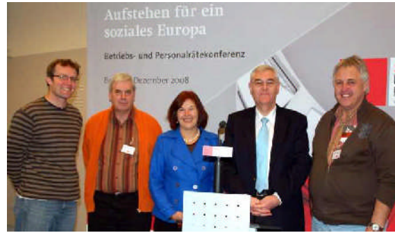
Betriebsrätekonferenz am 03. Dezember 2008 in Berlin.