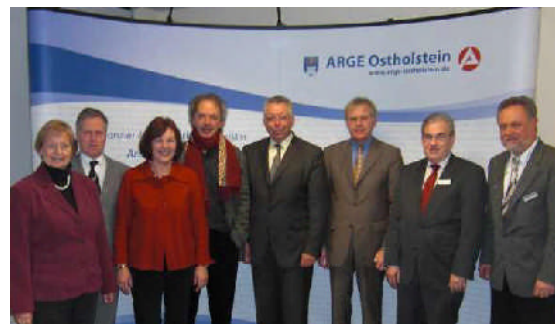
Der parlamentarische Staatssekretär beim Bundesminister für Arbeit und Soziales Klaus Brandner besuchte Ostholstein im Januar 2009.