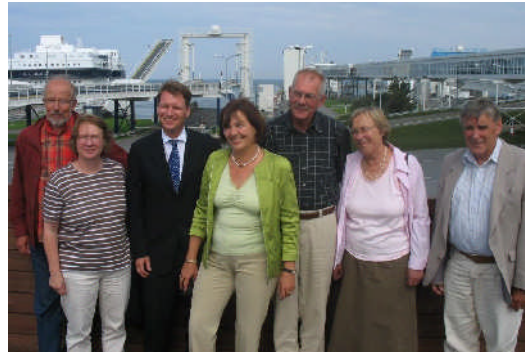
Fährbahnhof in Puttgarden am 24.08.07.

Betriebsrat von Scandlines - knapp 700 Arbeitsplätze allein auf Fehmarn hängen davon ab - fest „verdrahtet“. Die Privatisierungspläne von Scandlines habe ich sehr eng verfolgt, denn die Deutsche Bahn AG war mit 50 Prozent Anteilseigner. Der Verkauf von Scandlines im Sommer 2007 wurde vertraglich für die Beschäftigten gut abgesichert und erfolgte an das