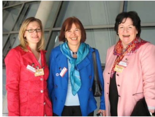
Ladies' Day 2007

stets Unternehmerinnen und weibliche Führungskräfte aus unseren Wahlkreisen für einen Tag nach Berlin ein – dabei sollen sie einerseits einen „Blick hinter die Kulissen“ des Politikalltags werfen können, andererseits wollen wir damit ein dauerhaftes Netzwerk zwischen Politikerinnen und Frauen in Führungspositionen von Wirtschaft und Verbänden knüpfen. Ich selbst habe in den vergangenen Jahren insgesamt 20 Frauen vor allem aus den für Ostholstein so wichtigen Bereichen Soziales, Bildung und Tourismus nach Berlin geladen. Der diesjährige Ladies' Day findet am 27. März 2009 statt – ich freue mich über neue Bewerbungen!