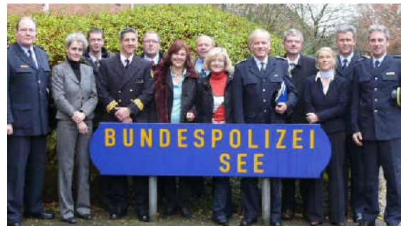
Mit Vertretern des Bundesministeriums des Inneren und Vertretern vor Ort besuchte ich im November 2008 das Maritimen Schulungs- und Trainingszentrum in Neustadt.