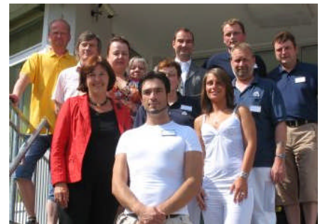
07.08.08: Infobesuch beim Betriebsrat der Asklepios Klinik in Bad Schwartau.

Berlin ein – die Nachfrage nach „Tickets“ dafür hat ständig zugenommen. Unter den 400 Teilnehmern der Betriebsrätekonferenzen sind auch jedes Mal 3-4 interessierte Betriebsräte aus meinem Wahlkreis dabei. Wegen der ständig steigenden Nachfrage habe ich im Februar 2008 zur 1. Betriebsrätekonferenz mit meinem Bundestagskollegen Franz Thönnies, Staatssekretär im Ministerium für Arbeit und Soziales, zum Thema: „ Gute Arbeit. Für faire Arbeitsbedingungen und faire Löhne “ eingeladen. Das Interesse war riesig: ca. 80 Betriebs- und Personalräte nahmen teil. Die 2. Betriebsrätekonferenz fand am 08.01.09 in Lensahn zum Thema „ Perspektiven für Gute Arbeit, Gegen Leiharbeit – für Mindestlöhne “ mit meinem Kollegen MdB Klaus Brandner, Parlamentarischer Staatssekretär im Bundesministerium für Arbeit und Soziales, statt.