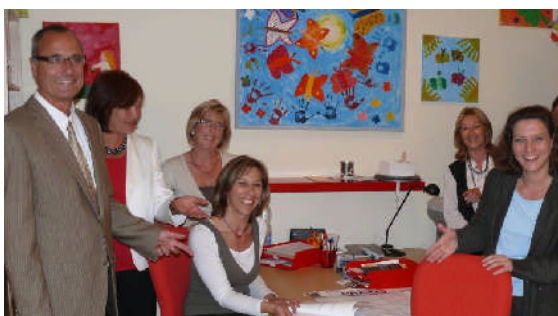
Besuch bei „Kinder auf Schmetterlingsflügeln“ am 01. September 2008.