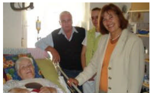
Praktikum Grömitzer Höhe am 12.09.06.

„Betreuten Wohnen“ und bei einem ambulanten Pflegedienst näher kennen zu lernen. Zuvor war ich schon in Pflegeeinrichtungen in Ahrensböök und Schönwalde - solche Praktika helfen mir manchmal mehr, um die drängenden Probleme im Pflegebereich zu erfassen, als das Studium von Aktenbergen! Im