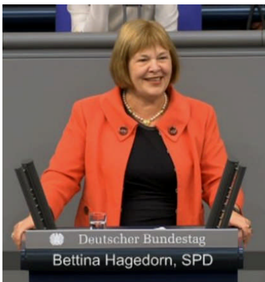
27.11.: ungewöhnliche 22 Minuten Redezeit für mich im Deutschen Bundestag zum Abschluss des Bundeshaushalts 2016 mit dem Verkehrsetat