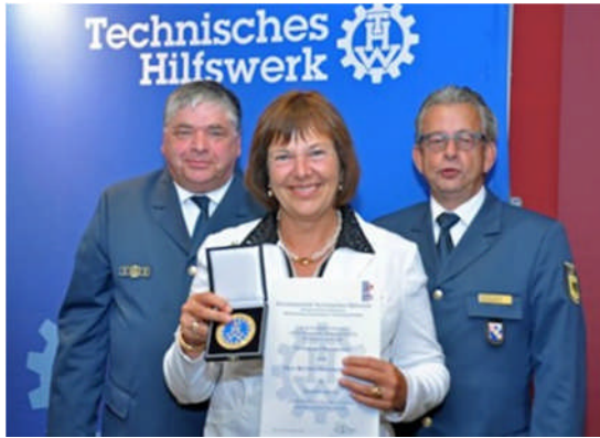
12.11.: Der Haushaltsausschuss beschließt 208 neue Stellen für das THW—und damit ein Plus von 25 Prozent des hauptamtlichen Personals für die 80.000 Ehrenamtler bundesweit. Foto vom August 2014, als ich die Ehrenplakette für meinen langjährigen Einsatz für das THW erhielt.