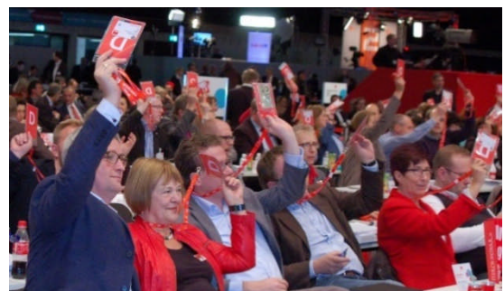
10.12.: breite Zustimmung auf dem SPD-Bundesparteitag von der schleswig-holsteinischen Delegation zu Leitanträgen Friedenspolitik, Integrations- und Flüchtlingspolitik und TTIP